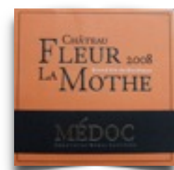
Ch.Fleur La Mothe

bouteilles de vin dans chaque catégorie si plus que 4 tireurs La remise des prix aura lieu à 17h00 au stand de Tir aux tireurs présents