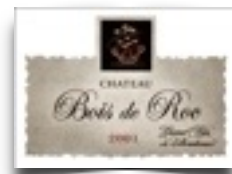
Ch.Bois de Roc