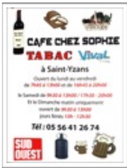
Bar Chez Sophie