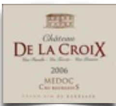
Ch.De la Croix

Tarif: Pour toutes les catégories, première série : 7 € par discipline, les suivantes : 5 €.