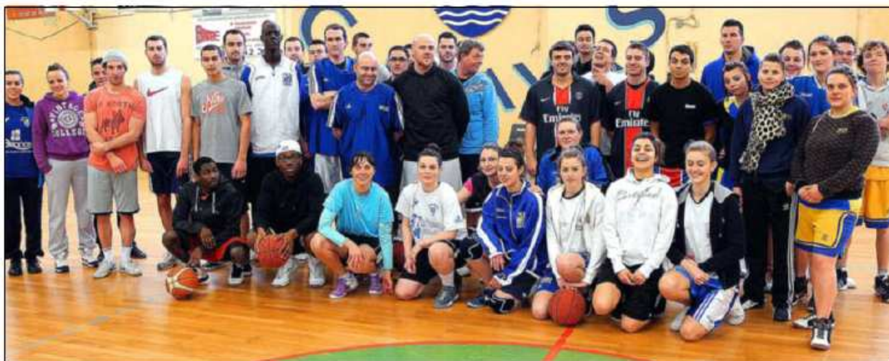
Cette nouvelle formule mixte de tournoi a été unanimement appréciée.

Dimanche, toute la journée, la section basket-ball des Gars du Reun a proposé, salle Jean-Kergoat, un tournoi nouvelle formule.