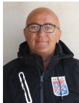
Philippe CATTELET (Conception)