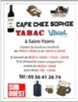
Bar Chez Sophie