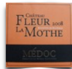
Ch.Fleur La Mothe

bouteilles de vin dans chaque catégorie si plus que 4 tireurs La remise des prix aura lieu à 17h00 au stand de Tir aux tireurs présents