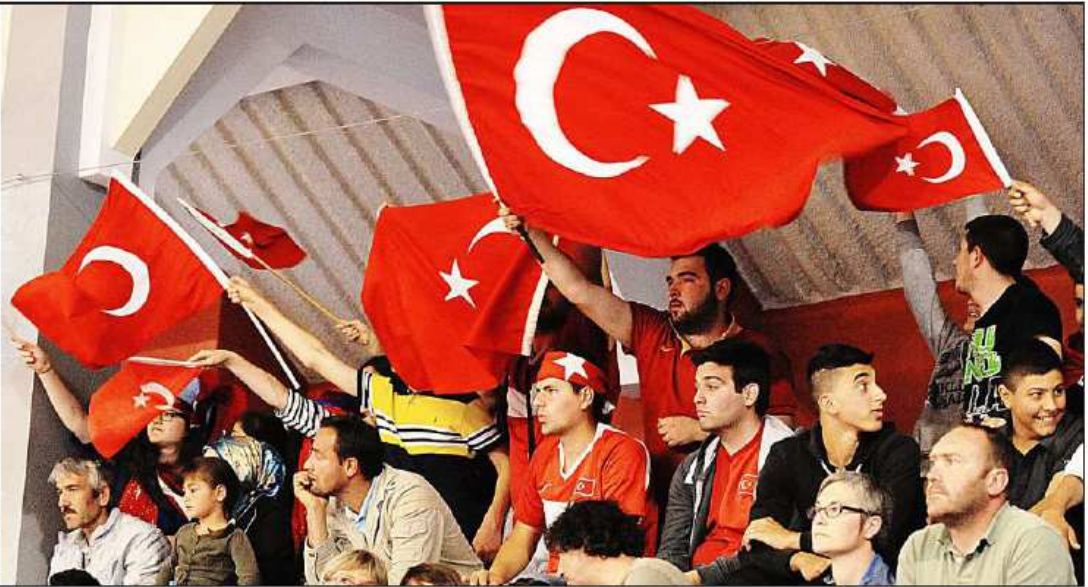
Chauds, chauds, les supporters turcs, membres pour la plupart de la communauté installée à Vannes. Au niveau de l'enthousiasme, ils sont loin devant les Suédois ou les Espagnols.

« Türkiye ! ». Devant les caméras de télévision, qui retransmettent en direct l'Eurobasket féminin, les supporters turcs ont créé une chaude ambiance, hier, à la salle omnisports de Kercado.