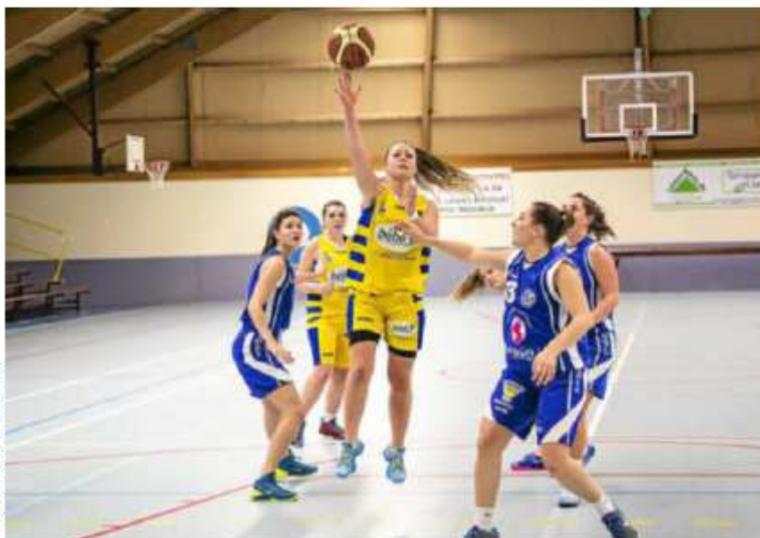
Après leur victoire face à Gouesnou le week-end dernier, Fiaut et les Langueusiennes joueront à Rennes, dimanche.

Guingamp, excellent devant les ténors de la poule, a toujours du mal à rééditer ses prestations face aux autres équipes. Cela s'est encore vérifié lors de sa défaite