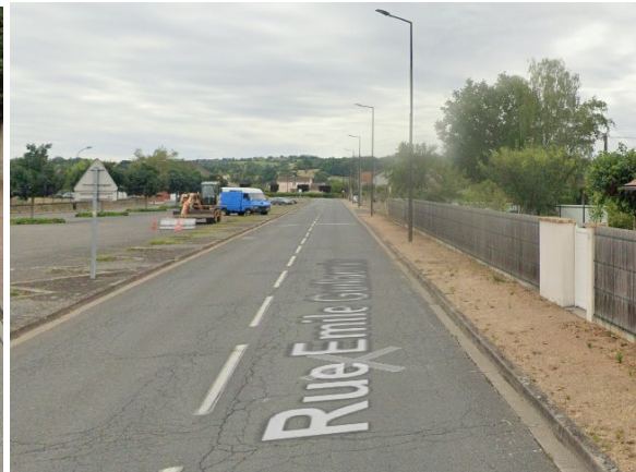
Ligne droite finale, longue de 300m