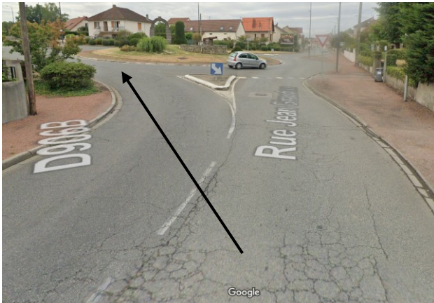
Rond-Point – 350m de l'arrivée