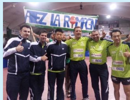
La Romagne Stella sports Champion de France de Pro A