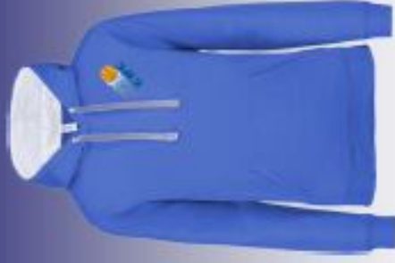
SWEAT Homme Femme Enfant : 21€