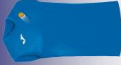
DEBARDEUR : 10€