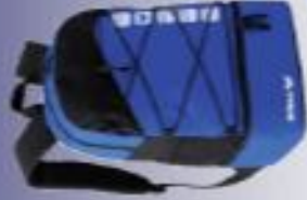
Sac à dos : 22€