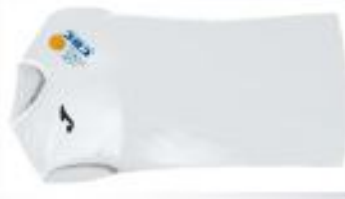
DEBARDEUR : 10€