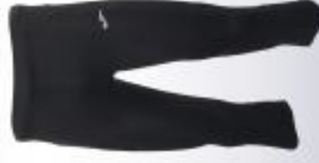
Legging 3/4 : 19€