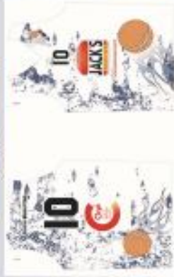
MAILLOT BLEU OU BLANC : 33€