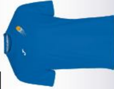
SURMAILLOT : 12€