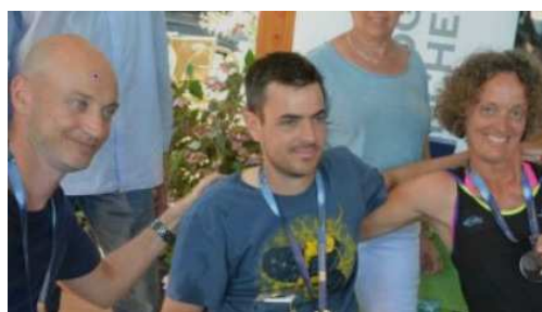
Championnat de France Tennis Fauteuil

Cet Open est une étape du circuit Tennis Fauteuil de la FFT, qualificative pour les Championnats de France individuels de la saison 2018/2019.