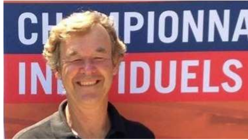
Championnats de France individuels