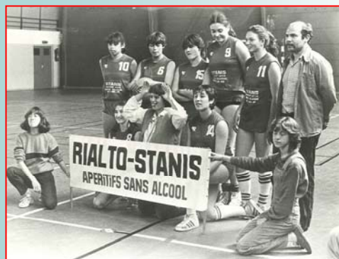
L'équipe de Stains dans les années 1975/80