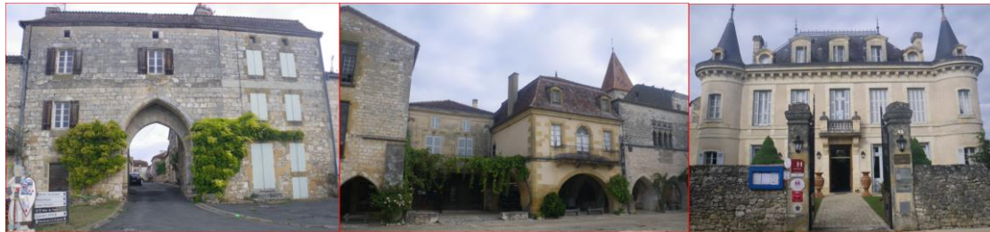
MONTPAZIER : UNE DES PORTES / LA PLACE / L'HOTEL 4**** ... PAS LE NOTRE !!!