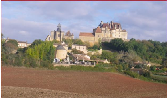
1CHATEAU DE BIRON