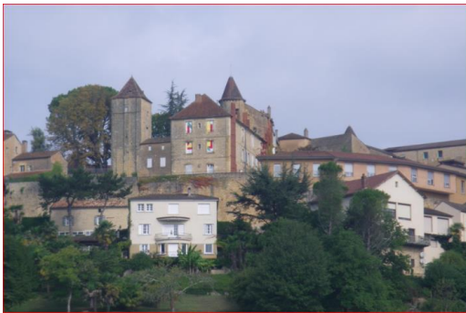
VUE DE BELVES ciel bleu le matin !