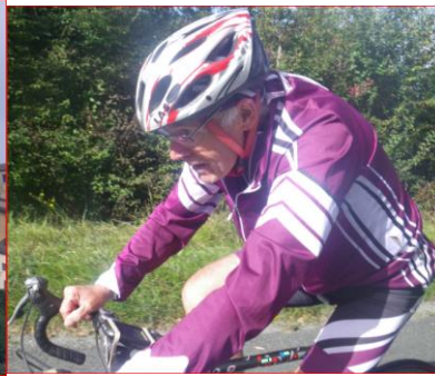
DEDE DANS L'EFFORT... CA MONTE !!!

Dimanche : départ sous la pluie fine mais persistante ci-dessous : Puy l'Evêque et château de Bonaguil.