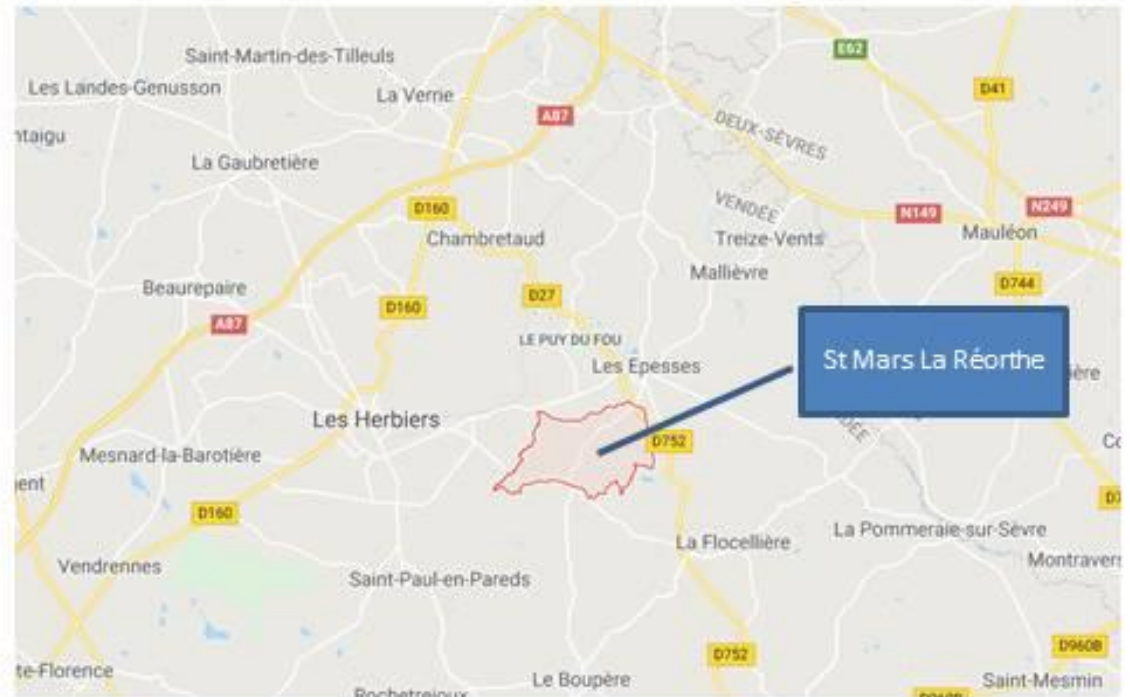
Site du bois des Jarries, itinéraire accueil fléché