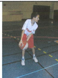
Passe façon « rugby »