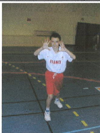
Deux mains pour cible