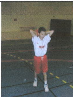
Ballon derrière la tête