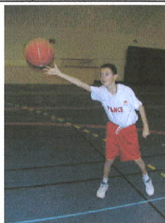
Une main pour cible