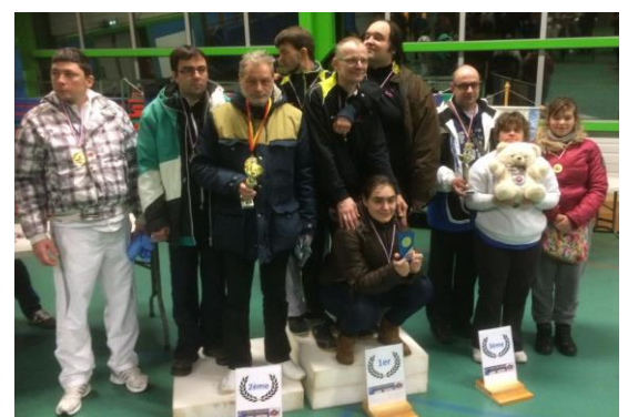
Par équipe : 3 ème