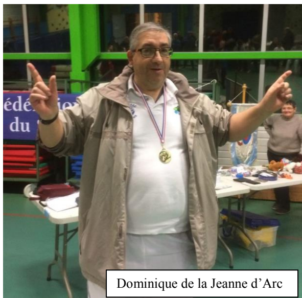
Dominique de la Jeanne d'Arc