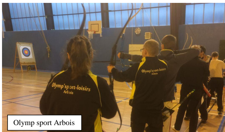
Olymp sport Arbois